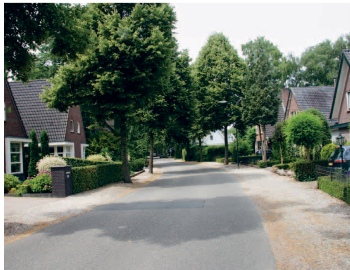
> Dorps dan dit kom je het niet tegen in de stad. Veel oude linten in Ugchelen liggen nog prachtig in het grind.