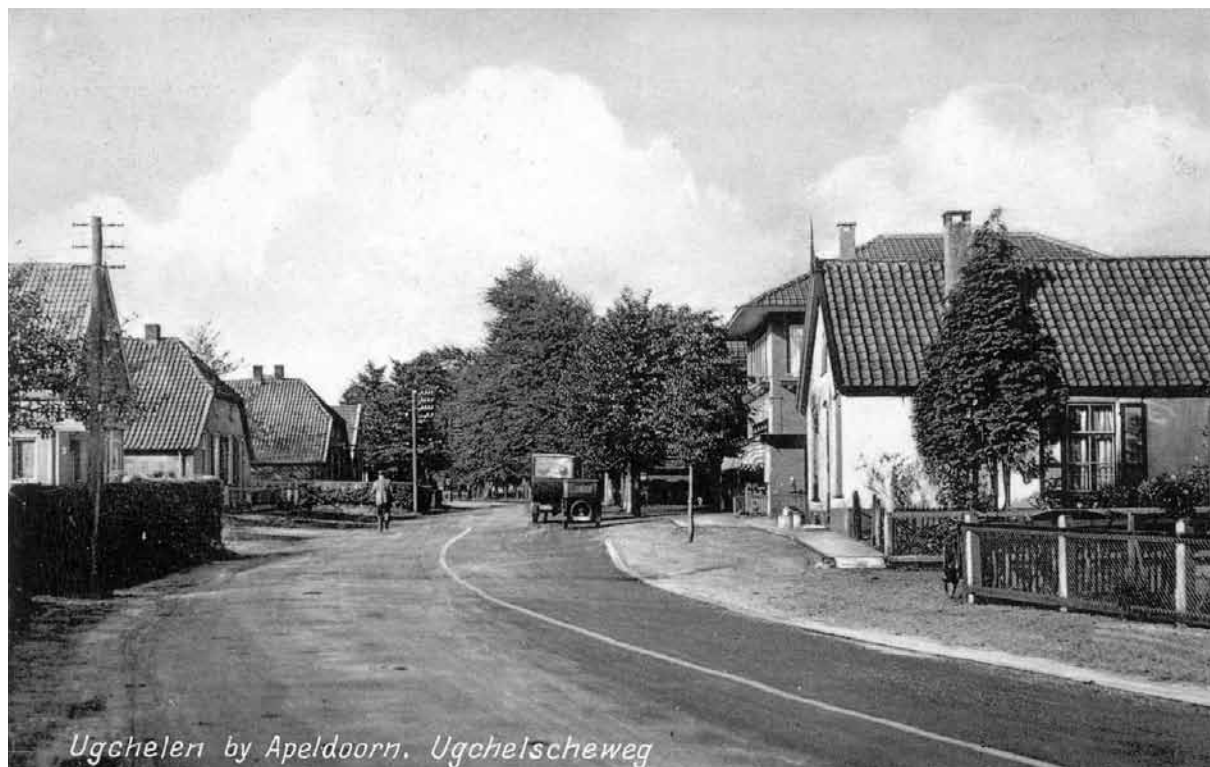
Ugchelen by Apeldoorn. Ugchelscheweg

> Het dorps- en bedrijvige gezicht van Ugchelen aan het begin van de twintigste eeuw met losse boerderijen langs kronkelige wegen (boven) afgewisseld met wasserijcomplexen langs de beken (onder).