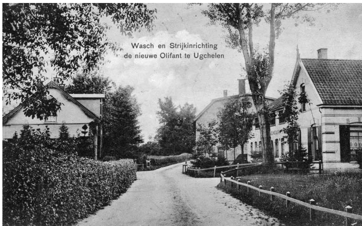
Wasch en Strijkinrichting de nieuwe Olifant te Ugchelen

> Het dorps- en bedrijvige gezicht van Ugchelen aan het begin van de twintigste eeuw met losse boerderijen langs kronkelige wegen (boven) afgewisseld met wasserijcomplexen langs de beken (onder).