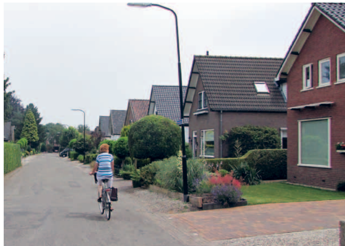
> Dorpse no-nonsense woningen. Geen van de woningen valt echt op, maar samen bepalen ze de grondtoon van het dorpse gevoel langs de linten.

Voor het dorpse beeld langs de linten komt het aan op behoud van een goede balans tussen de ingetogen dorpse en de uitbundige stadse woningen. De dorpse woningen vallen afzonderlijk niet erg op, maar gezamenlijk bepalen ze de grondtoon: rustig, eenvoudig, ingetogen en degelijk. Daarnaast is er af en toe best ruimte voor een wat extravaganter huis, zolang dit soort huizen maar niet de overhand krijgt.