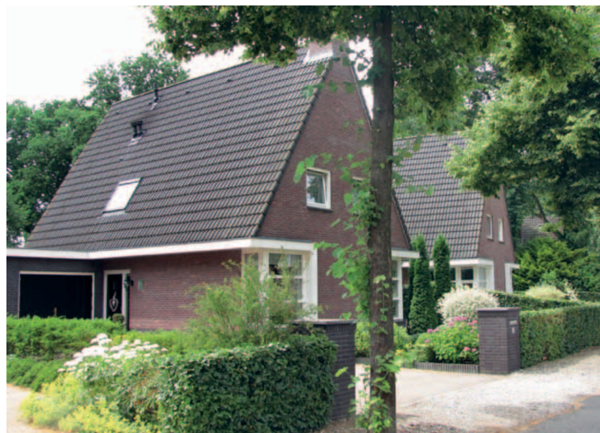
> Ook nu worden er nog woningen gebouwd die naadloos aansluiten op de dorpse traditie en eruit zien of ze er altijd al hebben gestaan.