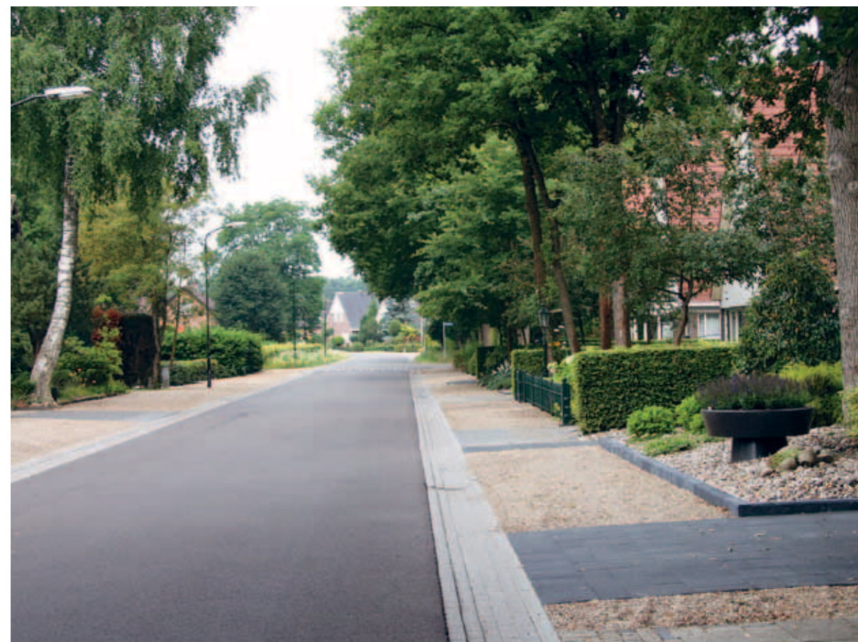
> Typisch Ugchelens: de inritten lopen vanuit de tuin door de grindbermen heen.