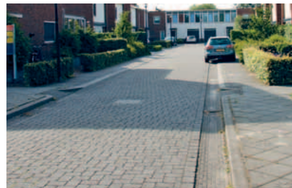
> De openbare ruimte bestaat uit rustgevende grijs tinten, soms met een subtiel detail.

De openbare ruimte heeft een aantal voor Osseveld Oost kenmerkende details. Bijvoorbeeld de manier waarop kruisingen zijn vormgegeven, in welk verband de stoepen zijn gelegd. Het zijn zorgvuldige en subtiele ontwerpen, juist door hun onopvallendheid. Ze zijn daarmee ook kwetsbaar voor verrommeling wanneer er extra parkeerplaatsen bijkomen, een hekje wordt geplaatst, een haag wordt weggehaald enzovoort. In een thematische wijk zoals Osseveld Oost gaat het ook bij kleine ingrepen er altijd om naar het grotere geheel te kijken. Het is goed om een verandering die al eerder is toegepast op meerdere plekken door te voeren met dezelfde zorgvuldigheid qua ontwerp en subtiliteit van materiaalkeuze.