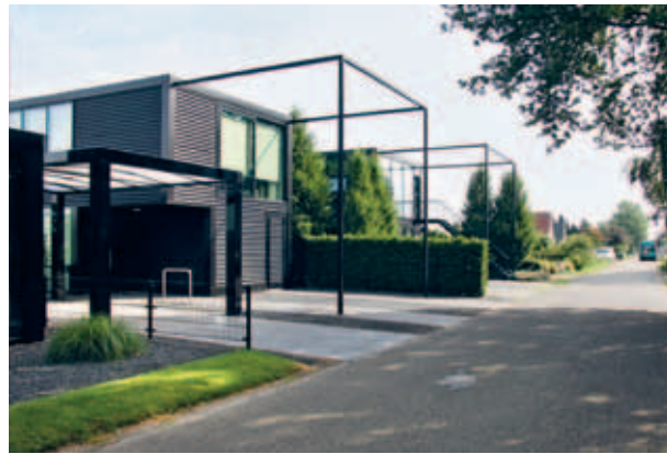
> De Veenhuizerweg: historie naast moderniteit. Juist die mengeling van stijlen geeft het lint karakter.