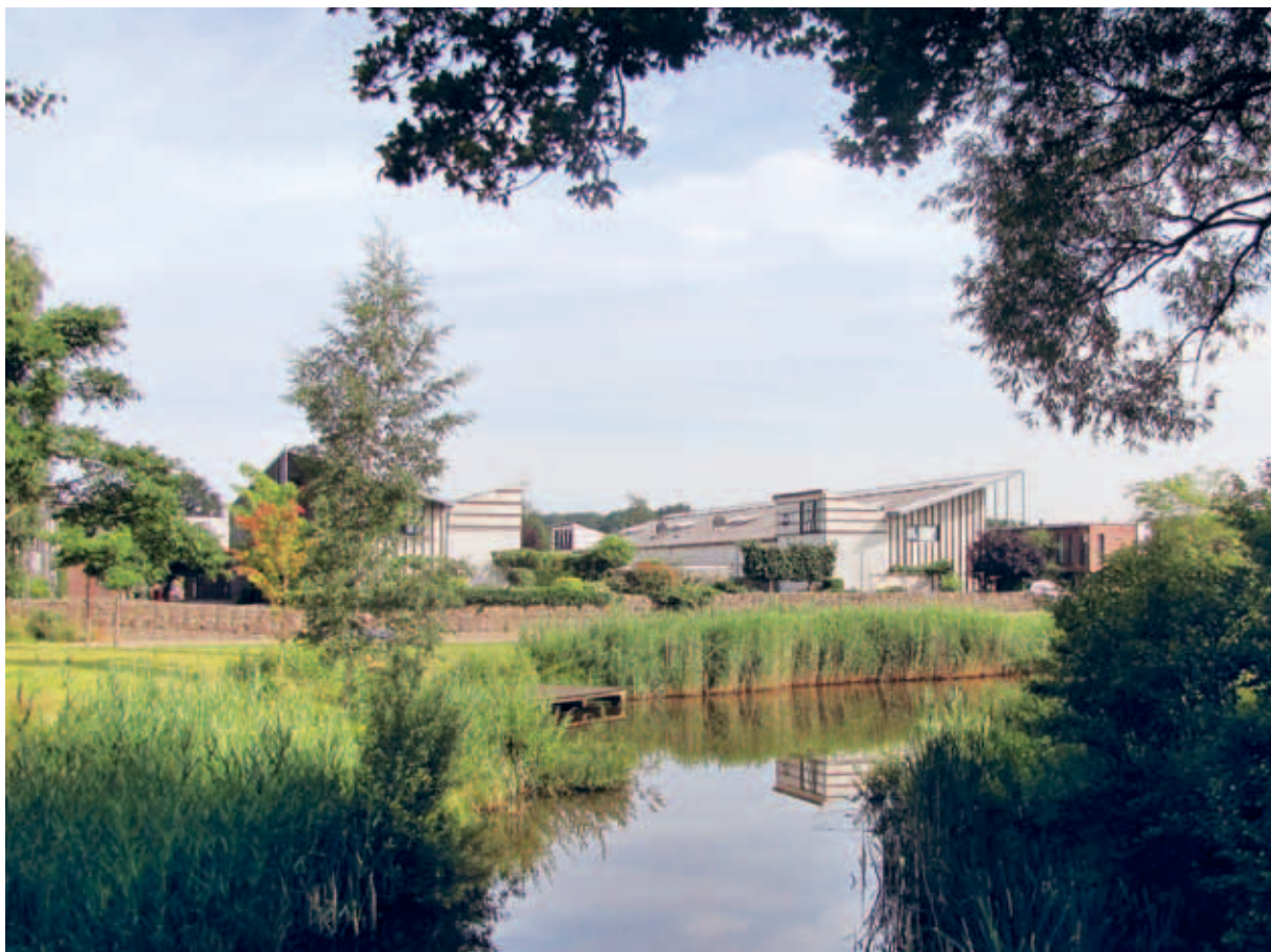
> De wereld binnen de romantische tuin is juist zacht, ruig en natuurlijk.