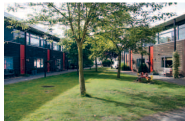
> Hofjes zijn eigen wereldjes waar je als een kijkdoosje in kijkt.