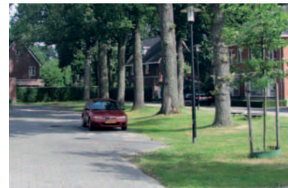
> Later toegevoegde parkeerplaatsen midden in een groenstructuur vallen dan ook direct uit de toon.