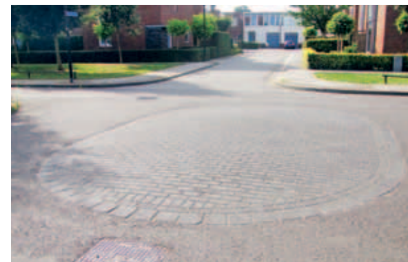
> Verkeerskundige oplossingen zijn onderdeel van het totaalontwerp. Rustig maar functioneel.