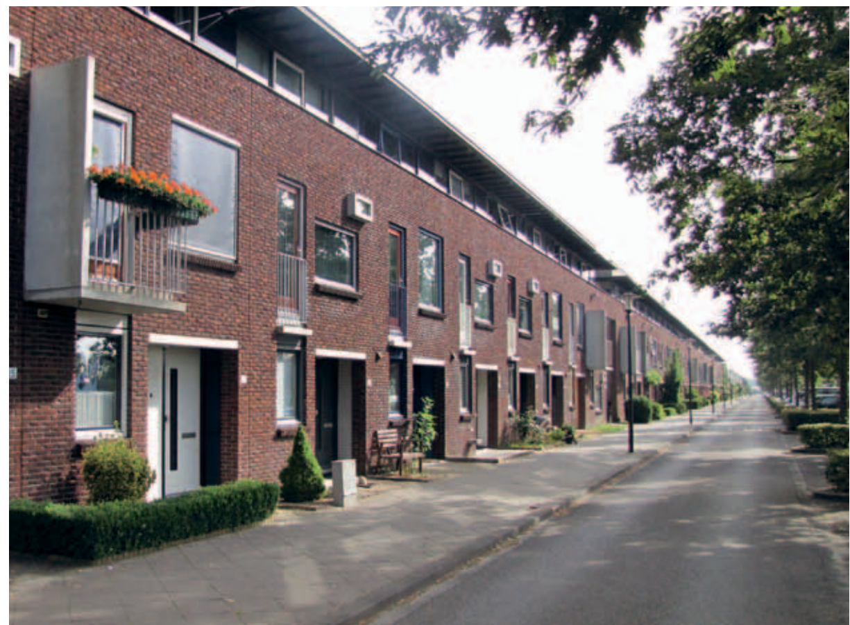
> De tuinmuur: alles is architectonisch ondergeschikt gemaakt aan het grote gebaar van de wand.

Binnen dat kader zijn twee bescheiden elementen, waarmee de eigen woning zich toch ten opzichte van die van de burens kan onderscheiden: de stoepzone voor de deur en de terugvallende entreepartij.