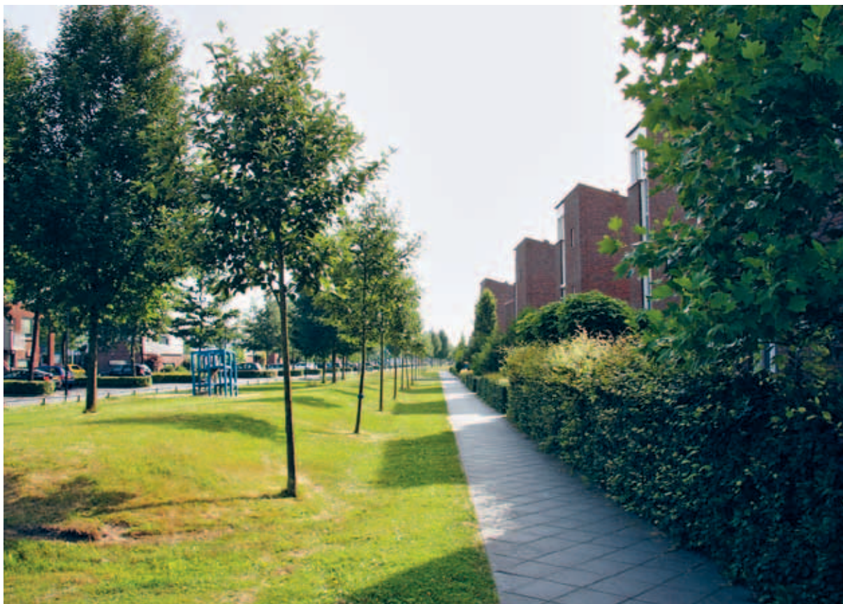
> Strakke lanen, hagen en gras begeleiden de hoofdstructuur van de wijk 'buiten' de romantische tuin.