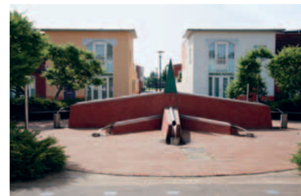
> Vanuit een thema is elk hofje anders ingericht.