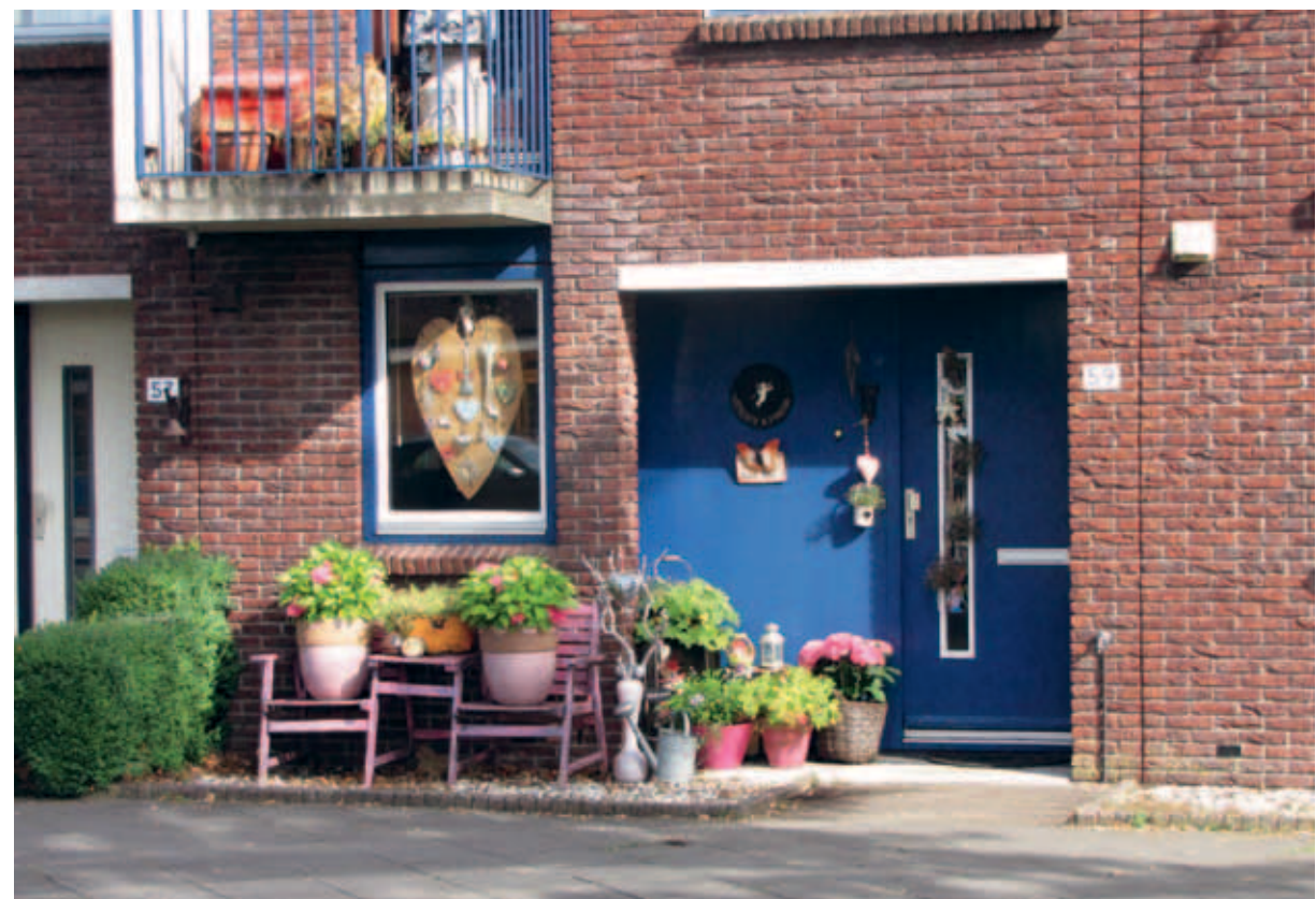
> De strook voor de woningen die in de tuinmuur opgenomen is, is de enige plek waar bewoners hun individualiteit kunnen tonen. Het wordt zo een visitekaartje van de bewoners.