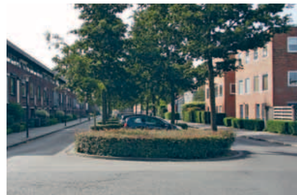
> Parkeren in de hoofdstructuur: keurig ingepakt tussen hagen waardoor je vooral groen ziet.