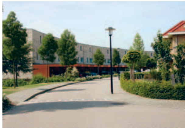
> De langgerekte vorm van de rijwoningen wordt nog eens benadrukt door een fors dakoverstek, een overstekende verdieping of een horizontaal doorlopende strook metselwerk met daarboven een opbouw in een ander materiaal.