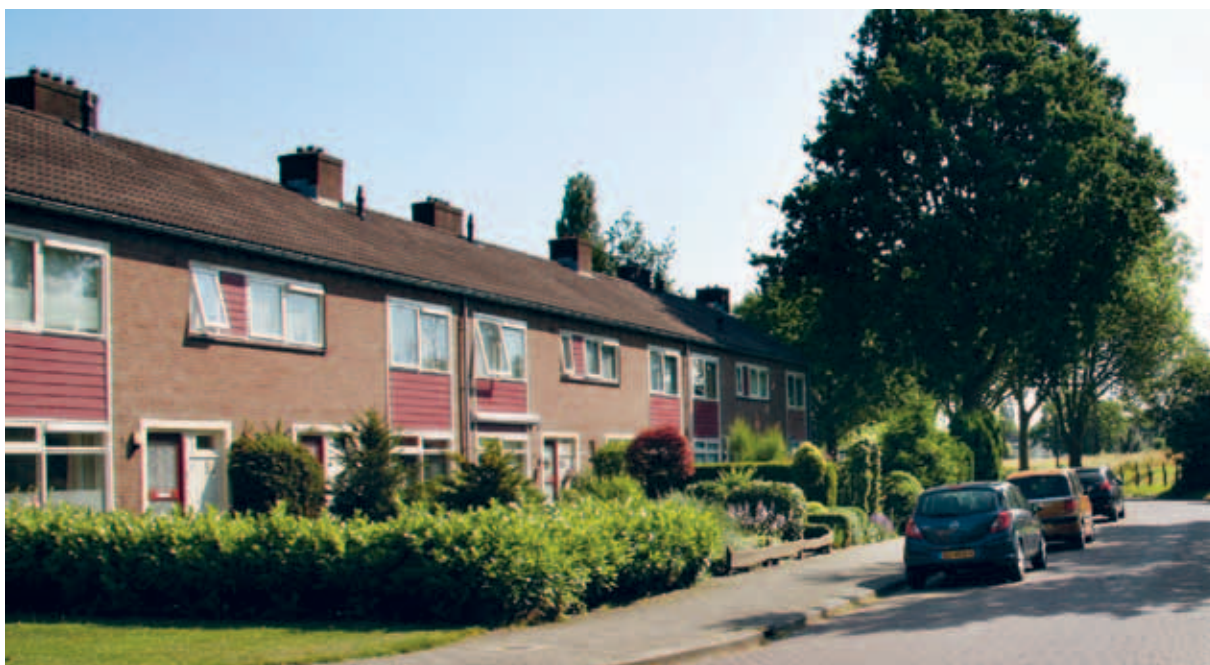
> Een bakstenen gevel met gevelpanelen in dezelfde kleur. Een rustig een eenduidig beeld.