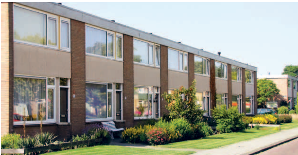
> Weinig baksteen maar toch een eenheid doordat de woningen allemaal dezelfde gevelpui hebben.