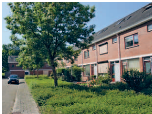
> Doorlopende dakgoten, betonbanden en metselwerk geven rust en ritme.