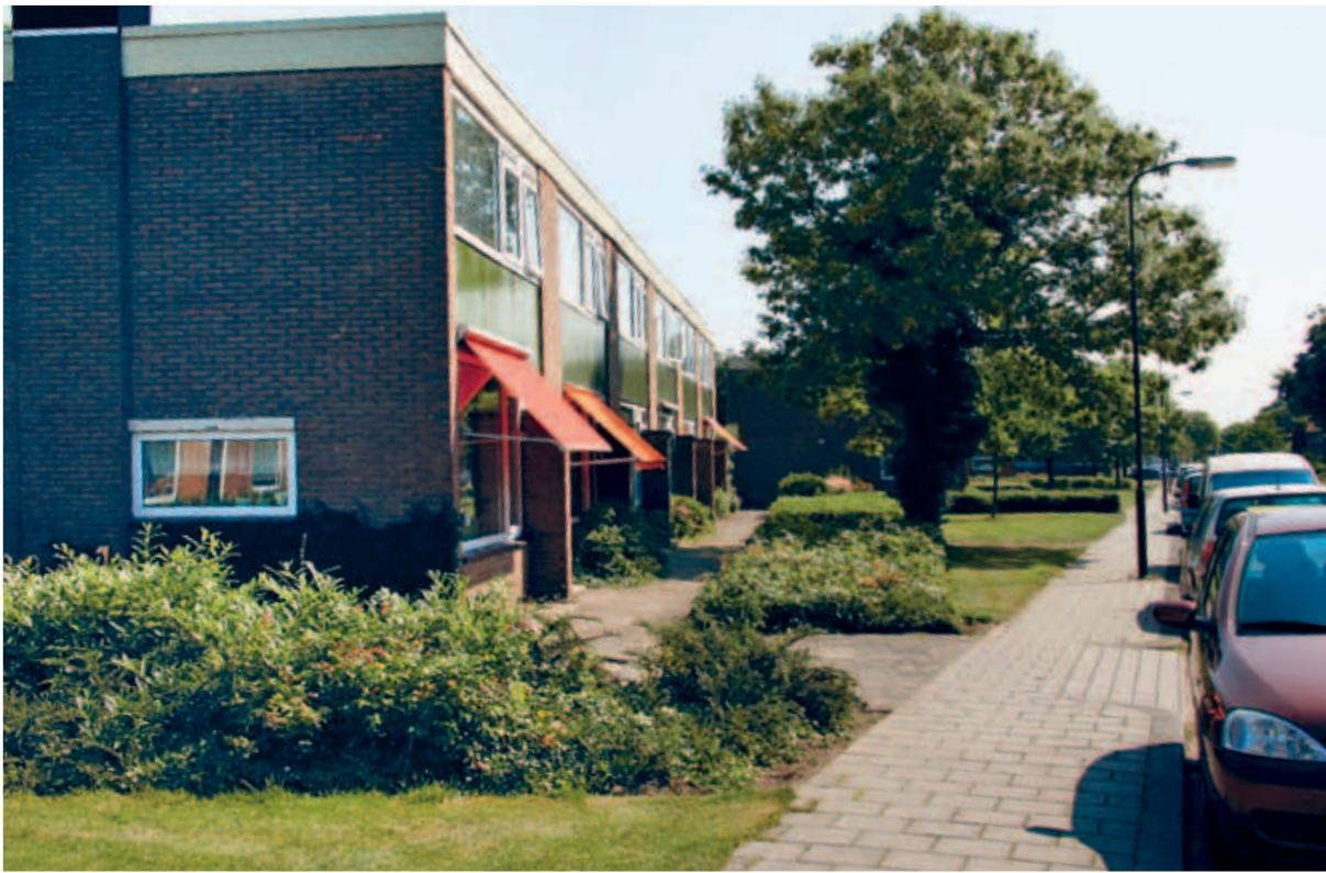
> De gelaagde overgangen tussen de huizen en de straat houden niet op bij de voorkanten. Ook de hoeken doen mee.

dezelfde regenpijpen, maar vaak lenen juist de verticale elementen zich goed voor aanpassingen aan de woning zonder dat dit totaalbeeld aantast. Het meest in het oog springende verticale element in de gevelpui van veel naoorlogse rijwoningen is een groot raam op de onder- en bovenverdieping met daartussen een paneel met een afwijkende materiaal of kleur. Het paneel is vaak het eerste aan onderhoud of vervanging toe. De kunst is om zoveel mogelijk het rijtje als eenheid te behouden.