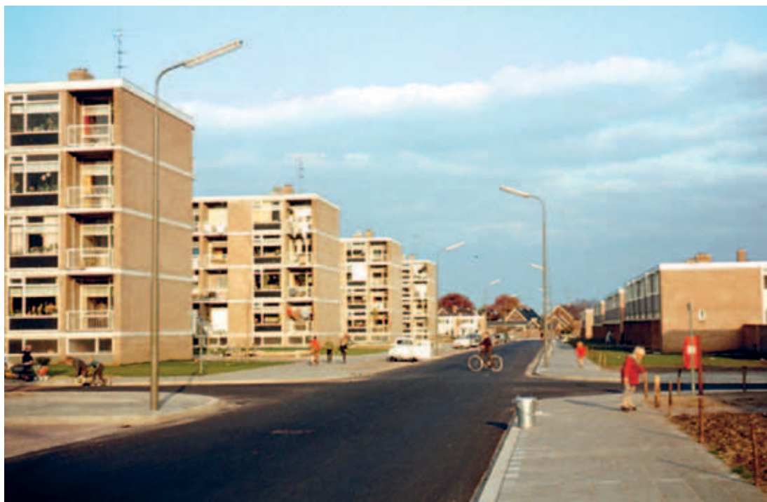
> De splinternieuwe Laan van Orden in 1964. Helemaal op de achtergrond is nog net een stukje van de oudere bebouwing zichtbaar.

Tussen eind negentiende eeuw en de jaren vijftig van de twintigste eeuw werd de oude Apeldoornse Enk tussen het Orderbos en het centrum van Apeldoorn steeds verder bebouwd door speculanten. Er ontstond een niet-planmatig bedacht of aangestuurd patroon van bebouwing. Toch bleef de woningdichtheid overal laag. De enk dreigde te veranderen in een structuurloze lappendeken van lintjes en huisjes.