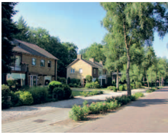
> De rust van de eenvoud: de herhaling van een eenvoudige vorm en materialen geeft een aangenaam contrast met het weelderige groen.