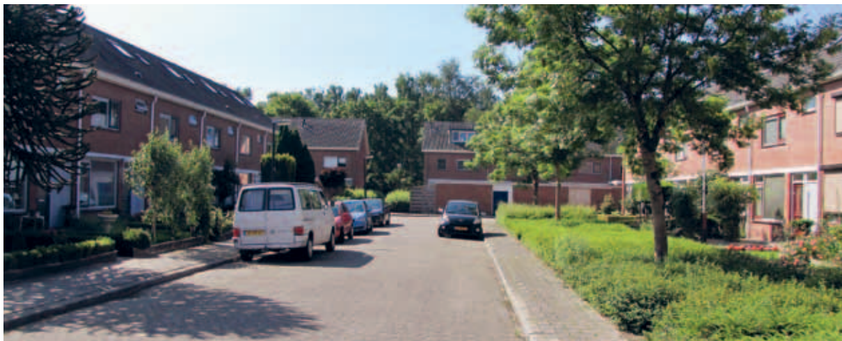
> Wel klinkers maar van beton in bijna dezelfde kleur als de stoep: het beeld wordt flets en grauw.