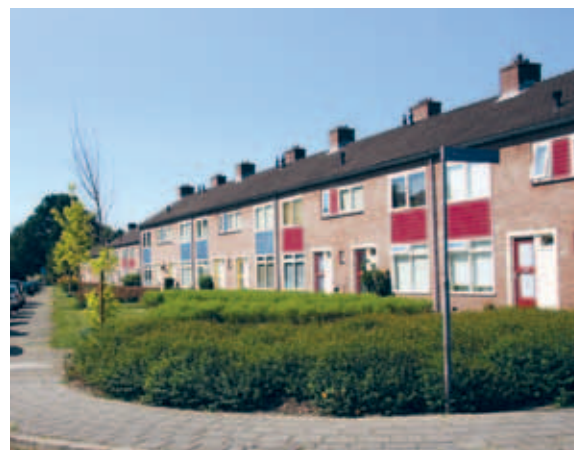
> Een bakstenen gevel met gevelpanelen in verschillende kleuren. Het wit van de kozijnen brengt nog net voldoende samenhang.