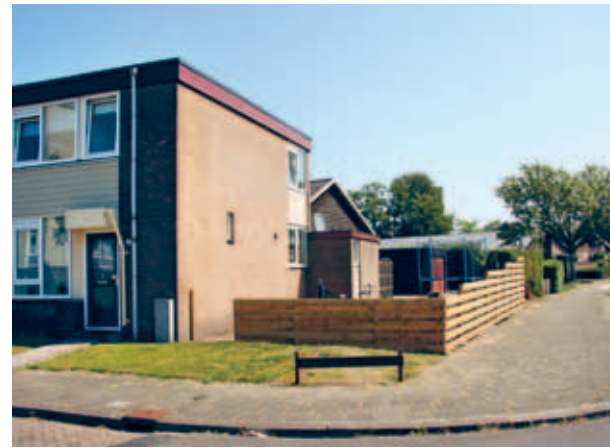
> Bij de uitgifte van openbaar groen en straathoeken aan particulieren verandert de gelaagdheid (zie links) al snel in een hoge schutting die het beeld alleen maar verschaalt.

In Orden staan de zijkanten van rijwoningen vaak duidelijk in het zicht, doordat ze niet parallel aan de straat staan maar licht gedraaid. Uitbreidingen aan de zijkant komen dan ook bijna altijd prominent in het zicht. Uitbouwen aan de zijkant zijn het mooist als de oorspronkelijke kopgevel nog te zien is. Het rijtje heeft daarmee een duidelijke 'boekensteun'. Houd uitbouwen daarom altijd laag, niet hoger dan de begane grond. Maak ze smaller dan de breedte van de kopgevel en leg ze iets naar achteren ten opzichte van de voorgevel. De architectuur kan het best aansluiten bij de soberheid van de rest van het gebouw.