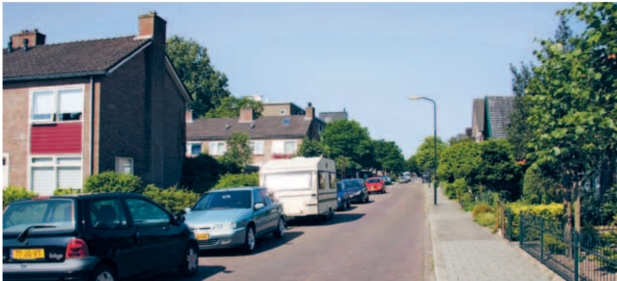
> Prettig en contrastrijk gedetailleerd wegbeeld met (oude) paarse klinkers en grijze stoepen: een echte woonstraat.