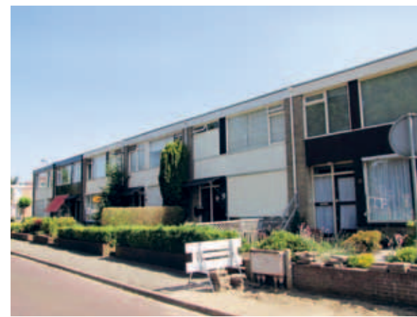
> Weinig baksteen en gevelpuien die allemaal anders zijn. De dakrand houdt het rijtje nog een beetje bij elkaar.