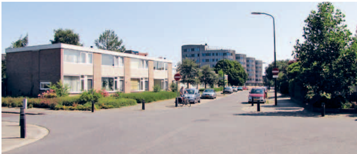
> Asfalt maakt de straten visueel breder doordat het geen details kent. Deze straat lijkt eerder een verkeersweg dan een woonstraat.