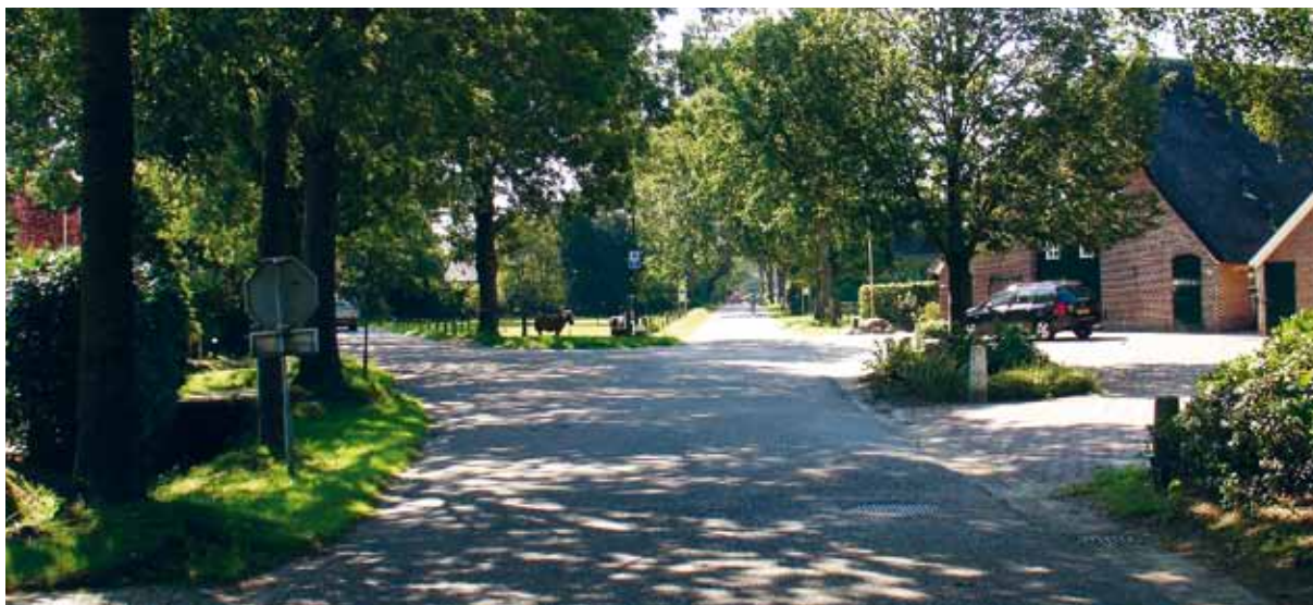
> De vele volwassen bomen langs de weg of op de erfgrans geven een lommerrijk beeld dat afwijkt van de andere dorpen van Apeldoorn.