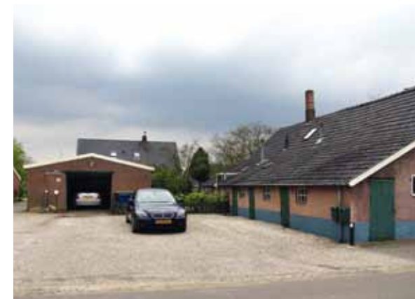
> Boerderijen staan met hun schuren 'koud' aan de weg, waardoor het erf en de openbare ruimte één geheel vormen.