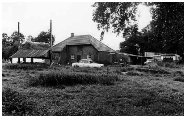
> Een dorpsbeeld uit de jaren zestig met een sfeer die ook vijftig jaar later nog precies zo aanwezig is.

In de twintigste eeuw is het losse patroon van boerderijen verder verdicht met burgerwoningen. Dit verliep zo geleidelijk en kleinschalig dat het dorp nog steeds aanvoelt als een historisch gegroeid geheel van individuele erven. Recent is voor het eerst planmatig een groepje bij elkaar horende woningen gebouwd.