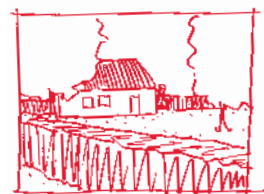
★ Maak grote kavels