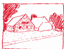
★ Zorg dat nieuwe gebouwen zich verhouden tot de grote volumes van de bestaande boerderijen