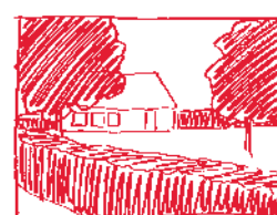
★ Gebruik hagen als typisch Oosterhuisense erfafscheiding