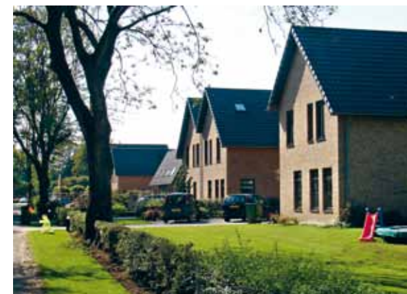
> Burgerwoningen of verbouwde boerderijen hebben wel een erfafscheiding. Allerlei typen hagen benadrukken de individuele identiteit van de kavel en geven een dorpsvariëteit. Nieuwbouwwoningen nemen dit thema over.