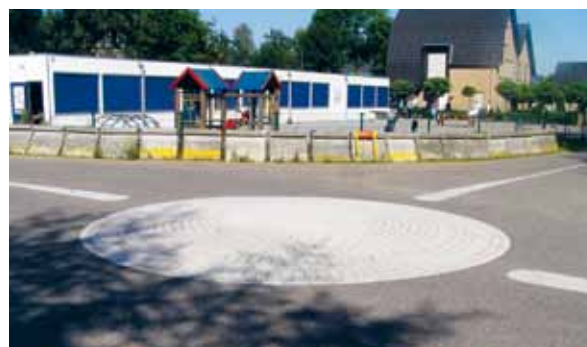
> De wegen zijn eenvoudig en landelijk ingericht. Op een enkel kruispunt zijn stadse elementen zoals dit soort markeringen geïntroduceerd die de onopvallende vanzelfsprekendheid van de rest van het dorp onderbreken.