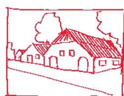
★ Oriënteer het hoofdgebouw op het bebouwingslint