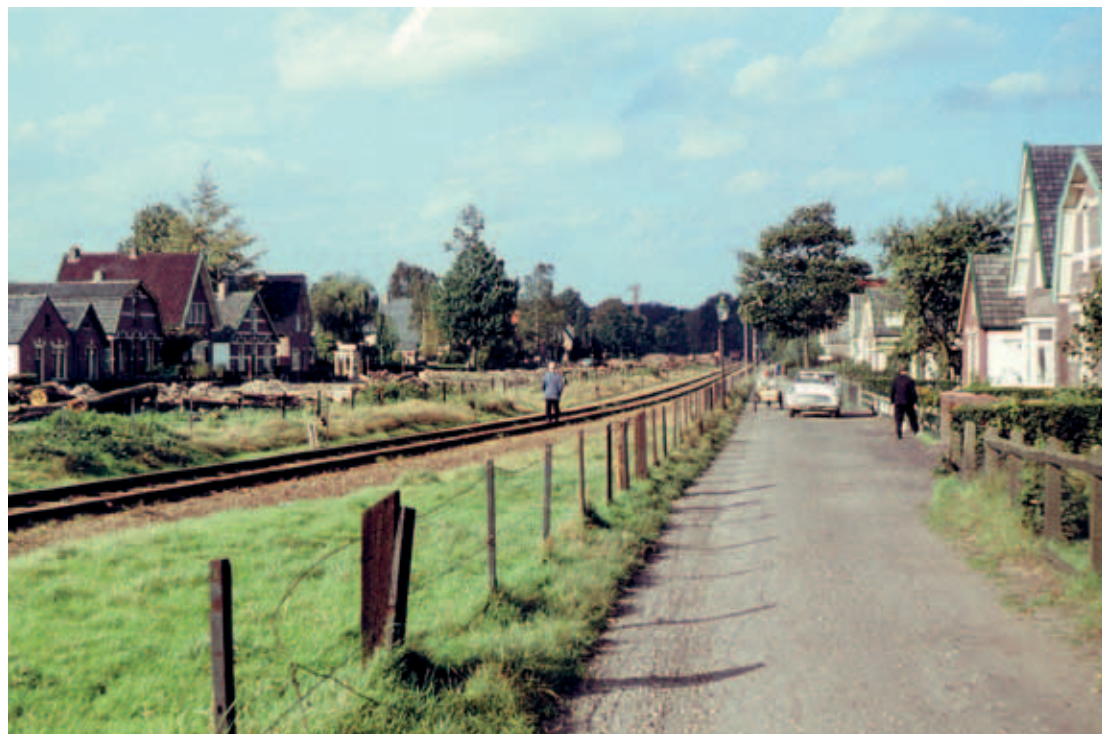
> De oude spoorlijn naar Het Loo op de grens van de Indische Buurt rond 1965. Tegenwoordig loopt hier de Koning Lodewijklaan: een vier rijen dikke lindelaan.

> Op de topografische kaart van rond 1900 is goed te zien dat het monumentale lanenstelsel van het paleis de oude landwegen doorsnijdt en zeer bepalend was voor de verdere invulling van de Indische Buurt.