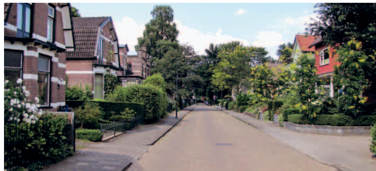
> Kenmerkend straatbeeld van de Indische Buurt waar de tijd lijkt stil te staan. Eenvoud overheerst maar wel met mooie (gebakken) stenen die goed passen bij het historische bebouwingsbeeld.

De Indische Buurt is een van de Apeldoornse 'grindreservaten' (zie intermezzo pagina 50). De straten waar nog grind ligt, zoals in de Badhuisweg, lijken sterk op de Ansichtkaarten van honderd jaar geleden. De grindbermen geven een historische uitstraling, maar zijn ook uitermate handig. Ze dienen als parkeerplaats, groeiplaats voor bomen, wateropvang en loopstrook ineen. Het grind hoeft en kan niet in elke straat terugkomen maar het is de moeite waard om bij herinrichting te kijken of er kansen liggen het historische beeld terug te brengen.