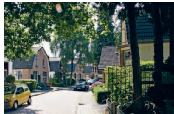
> Zuidelijker in de buurt worden woningen kleiner en het beeld eenduidiger: woningen staan strakker in het gelid en dichterbij elkaar.