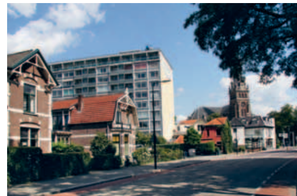
> Grootstedelijke plannen en projecten hebben hun sporen achtergelaten, waardoor het gebied vol vernieuwingslagen zit die sterk contrasteren met de fijnmazige lintjes met kleinere villa's.