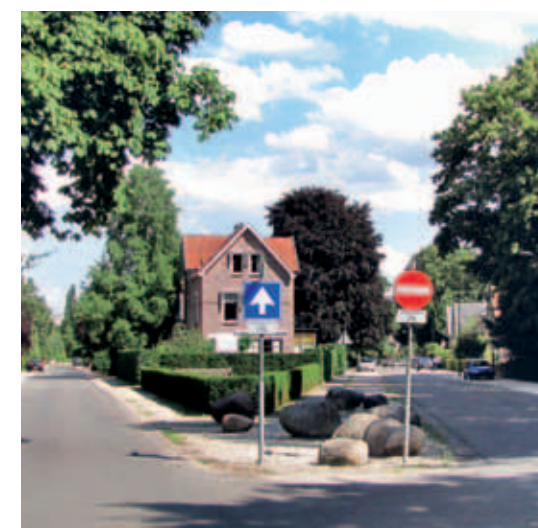
> Vorkvormige wegaansluitingen zijn aanleidingen en uitdagingen voor een zorgvuldig ontwerp. Helaas ontsieren in beide situaties paaltjes en borden het zorgvuldig ontworpen beeld.