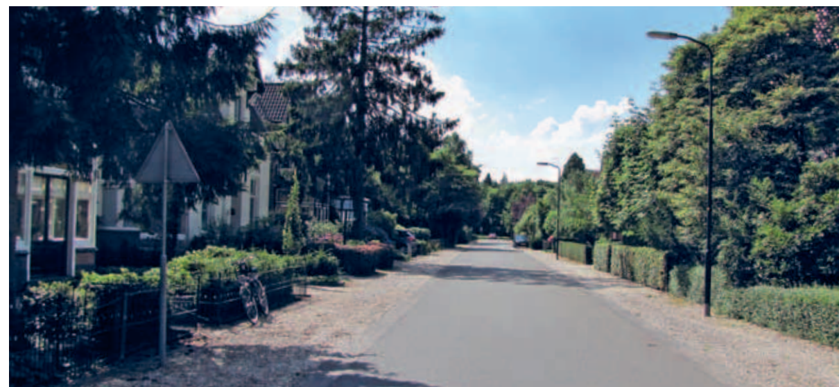
> Dezelfde tijdloze kwaliteit maar nu met grindbermen en asfalt. Het straatbeeld is met uitzondering van de lantaarnpalen bijna leeg. Toch is het niet kaal door de hoeveelheid en de variatie aan groen dat vanuit de tuinen 'aanschuift'.