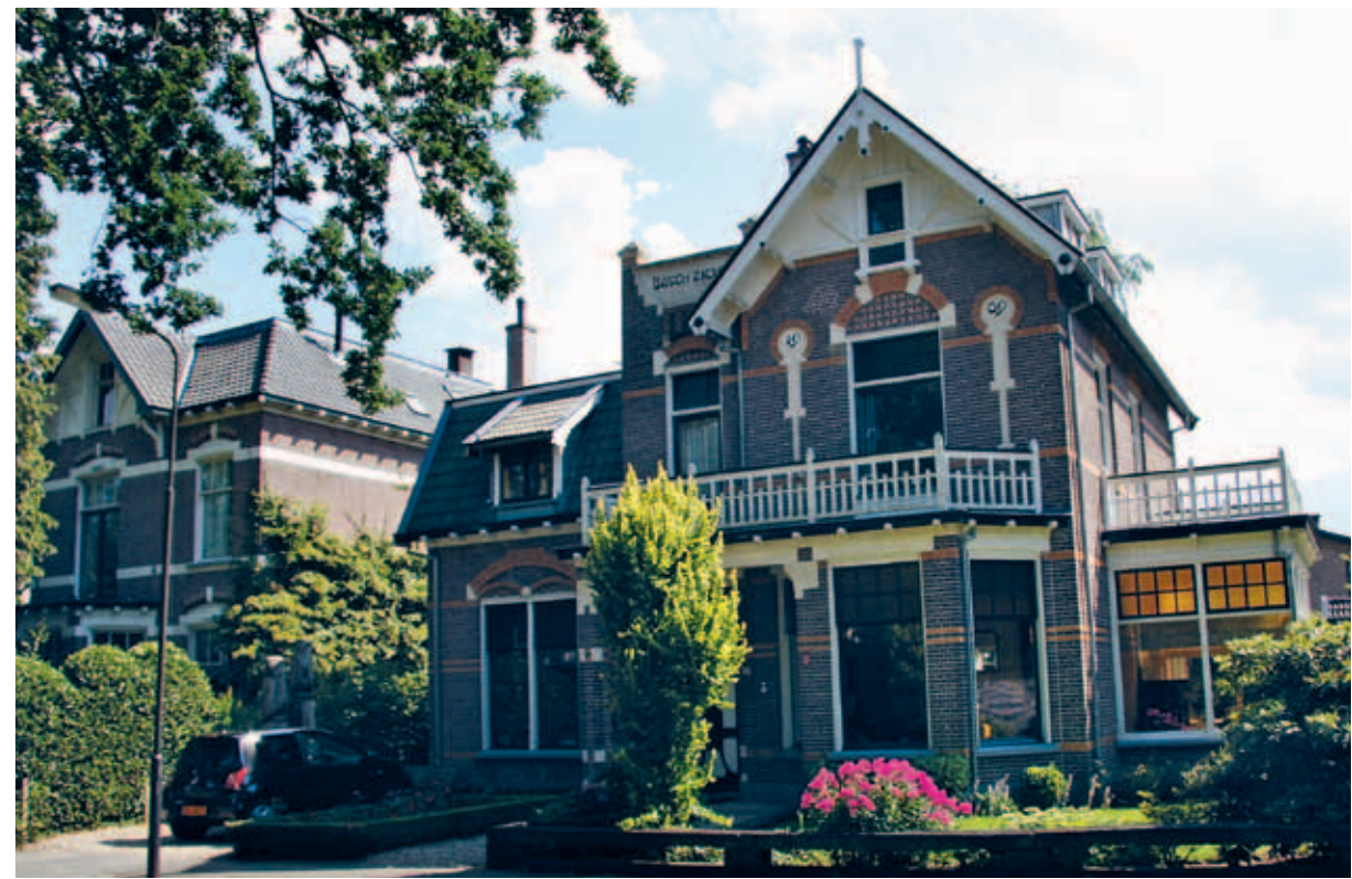
> Hoe dichterbij Paleis Het Loo hoe groter de kavel en de woning. Hier heerst nog de sfeer van de Parkenbuurt.