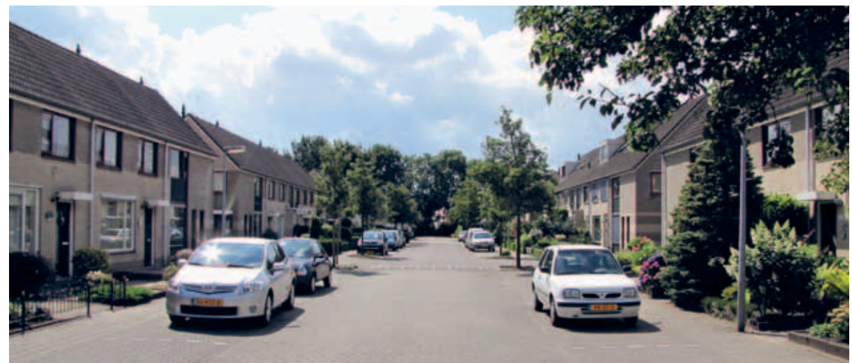
> Ter Maaden: een zeer breed woonerf in grijswitte tinten.