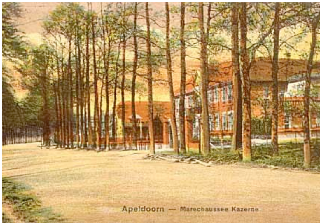
> De Van Haeftenkazerne in het begin van de twintigste eeuw.

Van de kazerne resten nu nog het hoofdgebouw, het patronenhuisje en zes blokjes met dienstwoningen die voor de officieren waren bedoeld. Deze woningen vormen de noordzijde van het Van Haeftenpark en de rand van de stad.