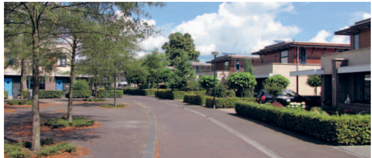
> Van Haeftenpark: herontwikkeling van het oude kazernecomplex tot een 'buurtje in een buurt'.