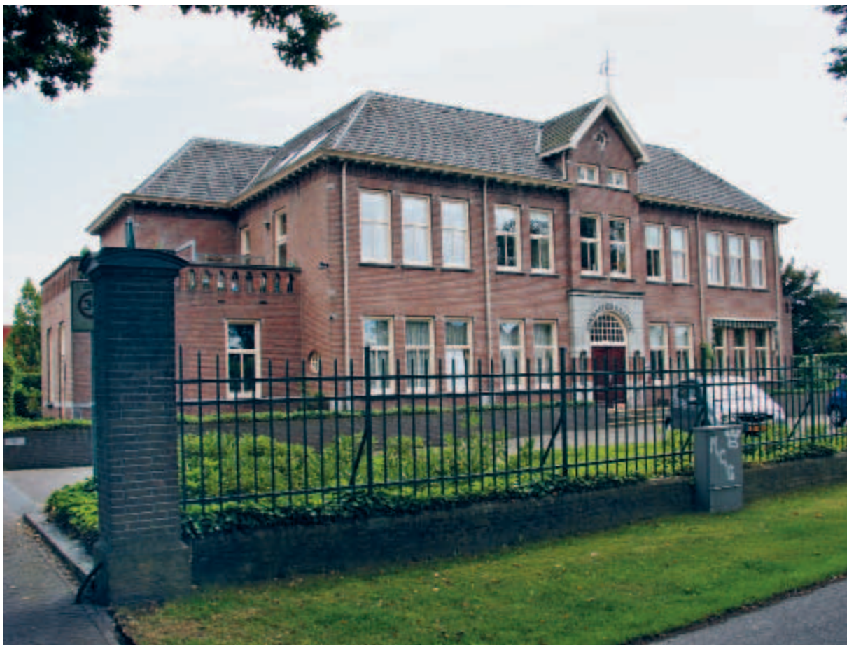
> Het hoofdgebouw van de Van Haftenkazerne uit 1911 vormt het visitekaartje van het Van Haftenpark.

brink. De woningen staan als soldaten strak in het gelid, rondom een groen binnengebied dat het hart van het Van Haftenpark vormt.