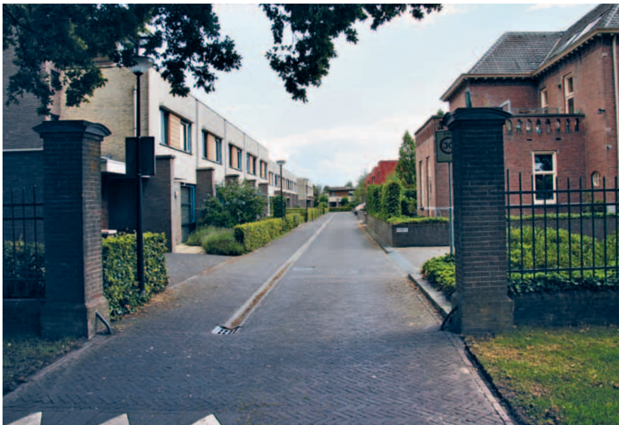
> Een buurtje in een buurt: de poort vanaf de Zwolseweg maakt duidelijk dat je een complex betreedt dat anders is dan de buitenwereld.

Omdat het buurtje nog jong is, zijn er nog weinig veranderingen doorgevoerd en heerst er nog een sterke eenheid. Voor de toekomst is het belangrijk die eenheid vast te houden. Dus niet één woning in een andere kleur schilderen of een paar hagen vervangen door muurtjes. Het is een basisrecept, maar voor een zorgvuldig ontworpen gebiedje zoals Hommelbrink extra belangrijk om aan vast te houden.