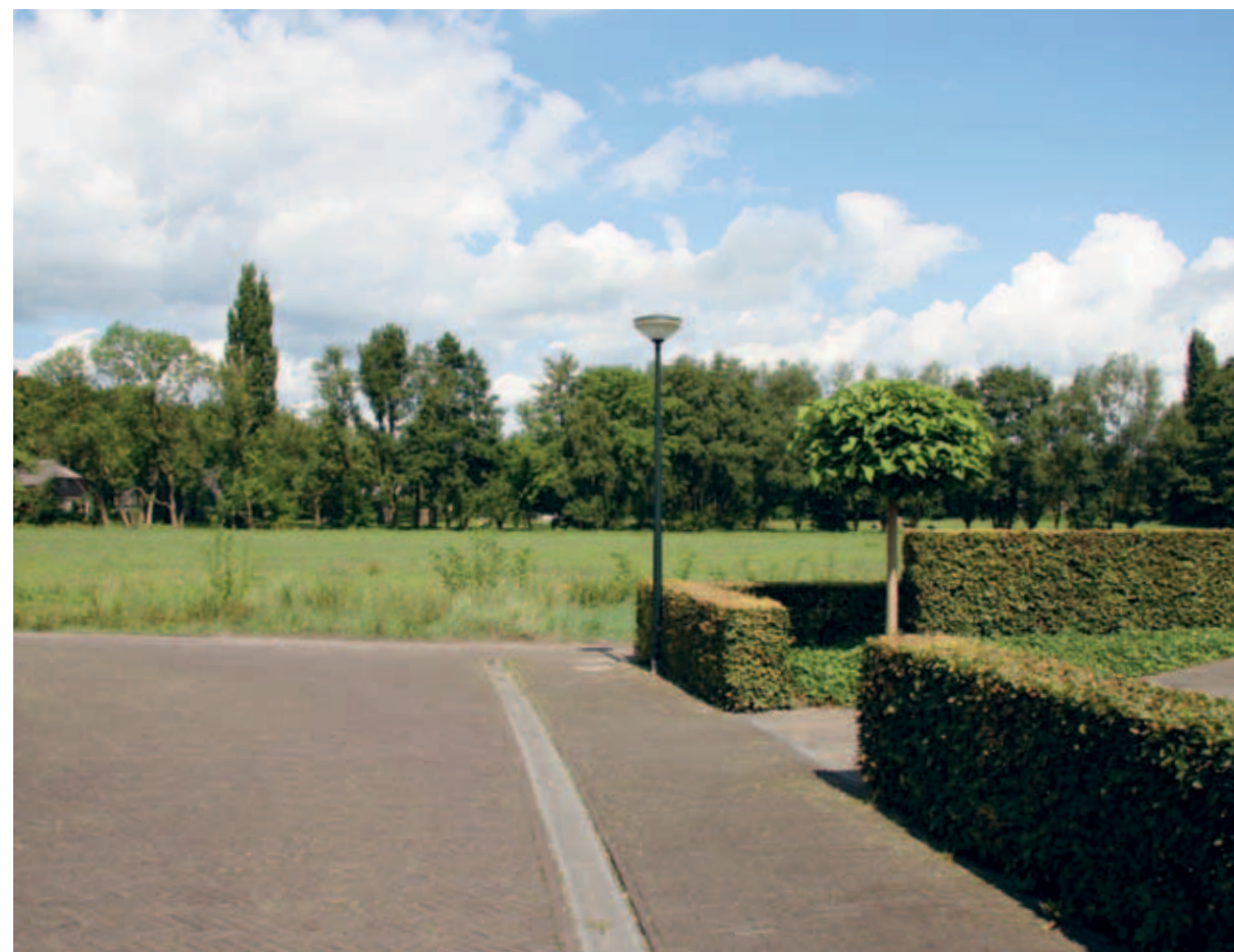
> Een zeldzaamheid binnen de stad: vrij uitzicht op het open buitengebied.