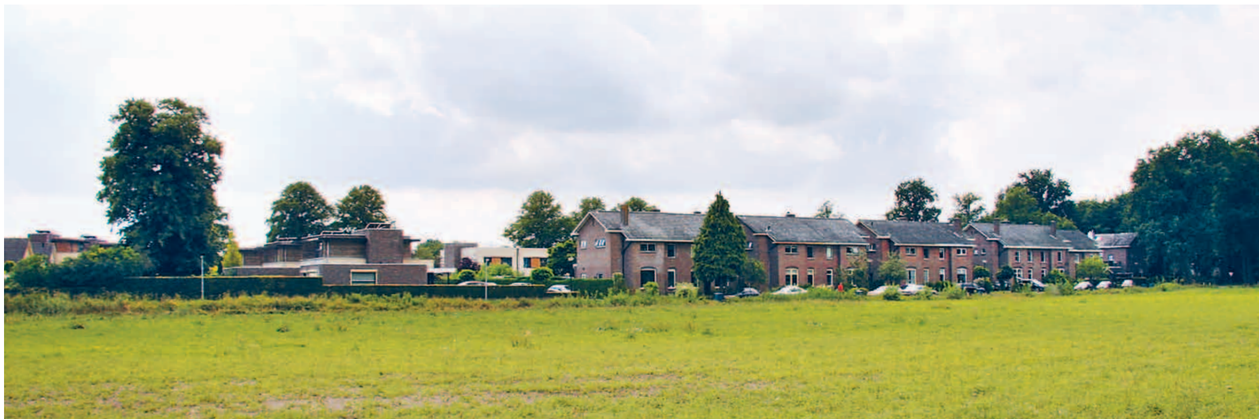
> Deze rand is niet de achterkant maar de voorkant van de stad en daarmee het visitekaartje. Zorg ervoor dat Apeldoorn zich juist hier op zijn mooist toont.