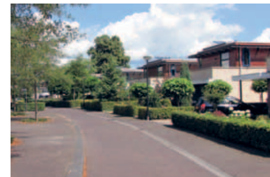
> De verschillende architectuur is aaneen gesmeed door een vloer van gebakken klinkers.