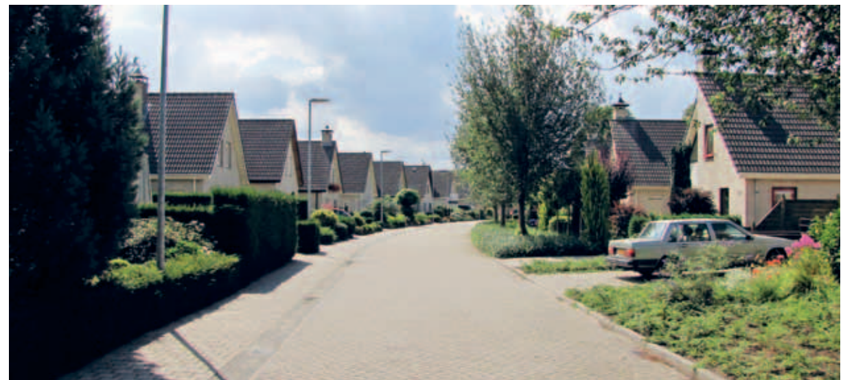
> De Jagershuizen: een typisch planmatig opgezette straat met jarentachtighuizen in witte baksteen.