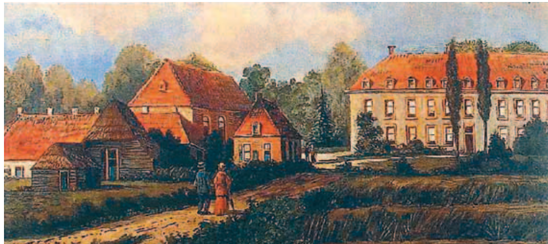
> Het onvoltooide 'grand projet' van Lodewijk Napoleon omstreeks 1860. Rechts het Groote- of Koningslogement, links één van de kerkgebouwen en het rijtje woningen van de Nieuwe Haven (olieverfschilderij,).

Buurtschap Het Loo dankt haar ontstaan grotendeels rechtstreeks aan de ontwikkeling van het paleis. In de omgeving van de Koningstraat werden eind zeventiende eeuw een nieuwe herberg en woningen voor de hofhouding gebouwd. Het gebied kreeg de benaming Oude Haven, dat waarschijnlijk verwijst naar het middeleeuwse goed Ten Haven.