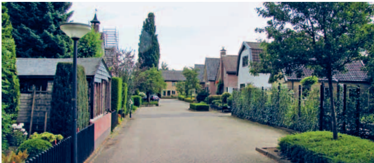
> De andere kant van Het Loo: allerlei woonerfachtige straatjes zonder trottoirs en met verspreid staande groenelementen.