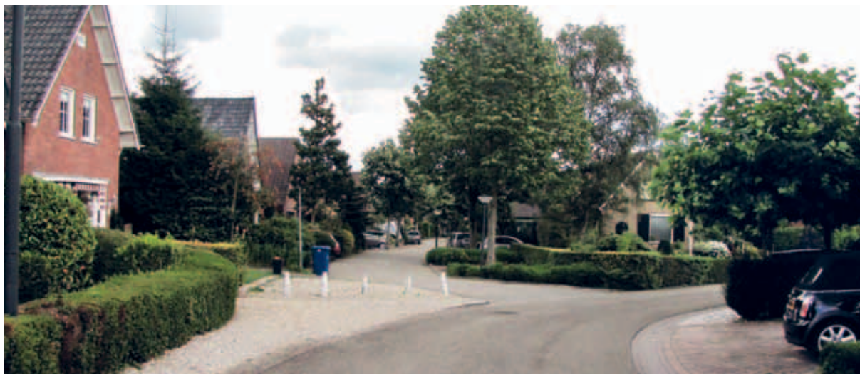
> Een oud lint met grindbermen is doorgeknipt, waardoor de historische lijn is veranderd in een onduidelijke restruimte zonder een duidelijke functie en met weinig kwaliteit.