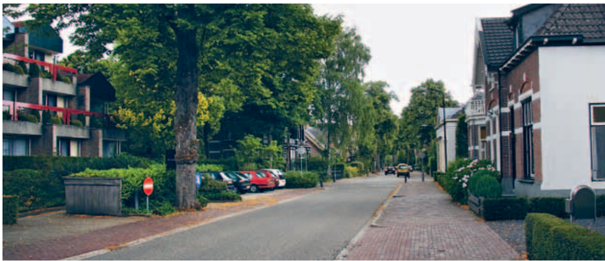
> Koningstraat: de historische drager van het buurtschap is herkenbaar aan de volwassen laanbeplanting en de klinkers in het trottoir.