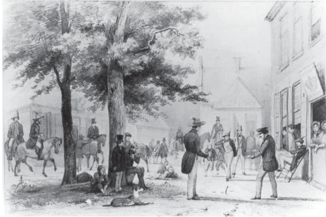
> Het gebied bij het paleis als levendig hart van het buurtschap rond 1840 met maar liefst drie herbergen zoals De Keizerskroon, het Posthuis en het Anker (tekening collectie CODA).