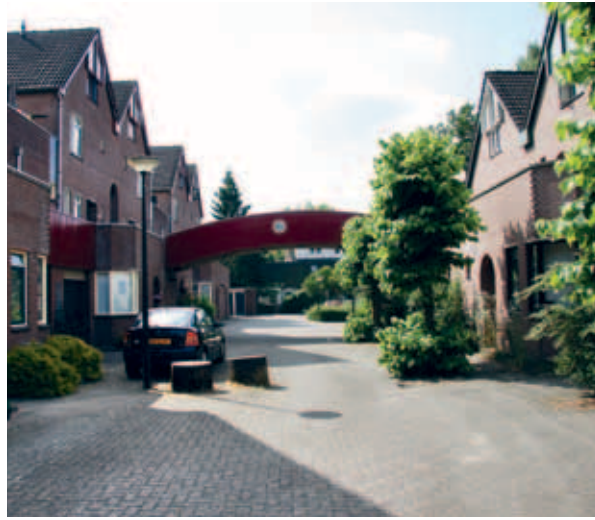
> De binnenkant van hetzelfde complex levert een heel ander beeld op: met veel meer variatie en menselijke maat.