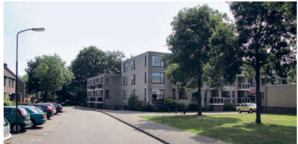
> De openbare ruimte is in de basis heel eenvoudig: grijs met groene kledjes van gras en bomen.

In het grijze tapijt liggen veldjes, strookjes, parkjes en groenzones: de groene kledjes in de wijk. In lijn met de wooneropzet is er ook kleinschaliger groen: solitaire bomen, haagblokken en perkjes. Op veel plaatsen worden de groenelementen aangevuld met straatmeubilair zoals paaltjes, lichtmasten of muurtjes, waardoor de openbare ruimte soms druk aandoet. De Heeze zou aan kwaliteit winnen door de openbare ruimte te vereenvoudigen en terug te brengen naar meer eenheid in bestrating, soorten groen en meubilair.