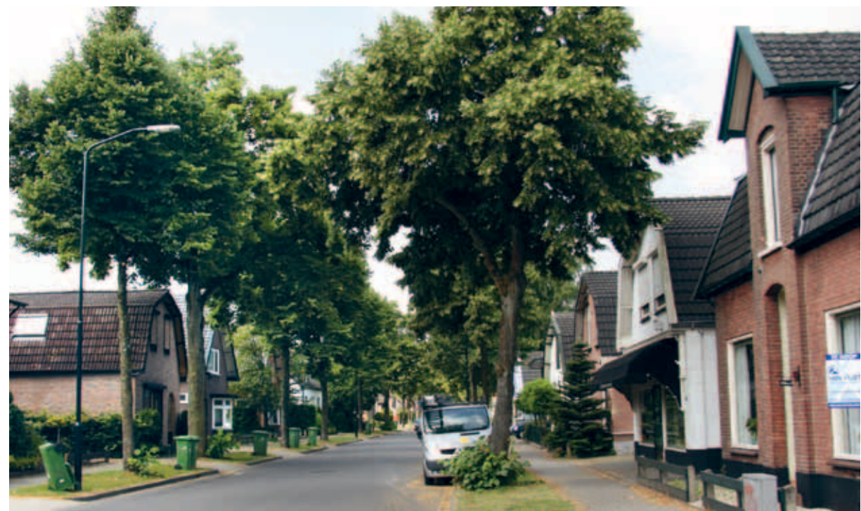
> Oude linten volgens grootmoeders recept gebouwd, verwijzen nog naar de agrarische oorsprong.

In Winkewijert was de ruimte tussen de linten wat kleiner en is de invulling ertussen beperkt gebleven tot enkele buurtjes van vooral rijwoningen rondom de Carrouselweg en de Vlietweg. Rondom de Parelhoeder verrees recent een nieuw buurtje, dat ook bestaat uit eenvoudige rijwoningen van twee lagen met een kap.