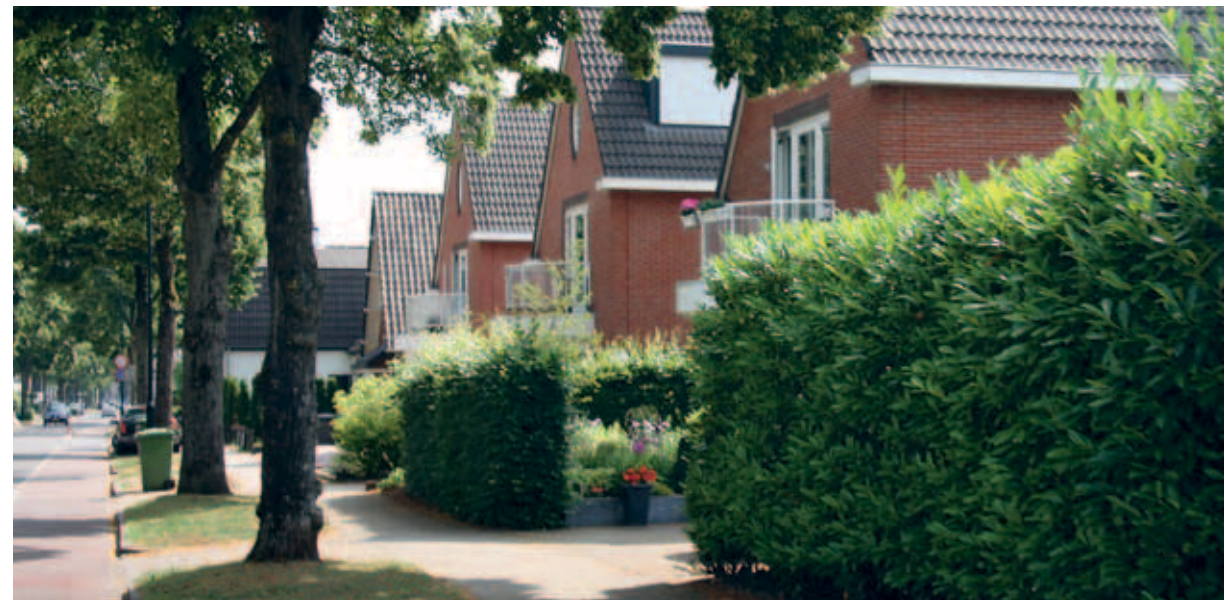
> Ook nieuwbouw kan prima langs de linten, zolang het maar ongeveer even groot is als het bestaande.