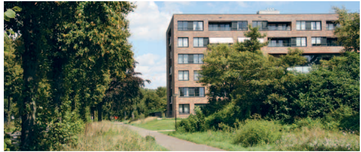
> Grote gebouwen staan in De Heeze altijd aan de rand van de buurt, waar ze aansluiten op de grote maat van de wegen buiten de wijk.