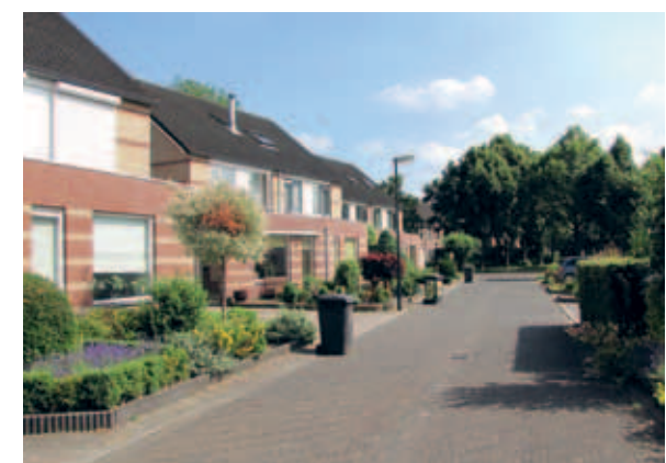
> Andere architectuur: zelfde recept en resultaat.