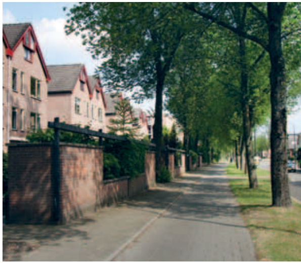
> De buitenzijde van het complex is strak en fors door de langgerekte tuinmuur en het laanprofiel. Dit past bij de stedelijke weg die er langs ligt.