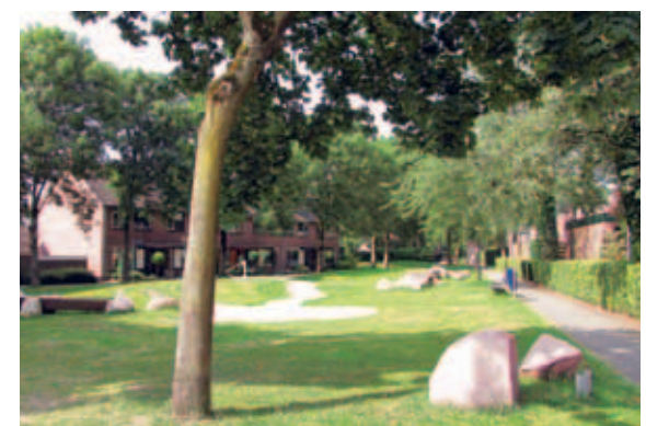
> De groene zone die midden door De Heeze loopt is het mooist op de plekken waar hij eenvoudig is ingericht met heldere randen (haag of voortuinen), gras en bomen.