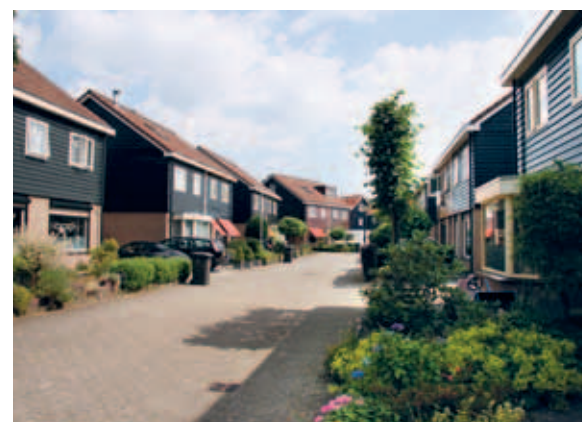
> Lekker rommelig gestrooide woningen en een net afwijkend kleurgebruik maken dit tot een mooi buurtje. Meer is niet nodig.