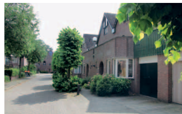
> Rond de woonerven wordt die helderheid nogal eens ondermijnd door een veelvoud aan elementen, zoals hier de leibomen met onderbeplanting, plantenbakken en paaltjes.