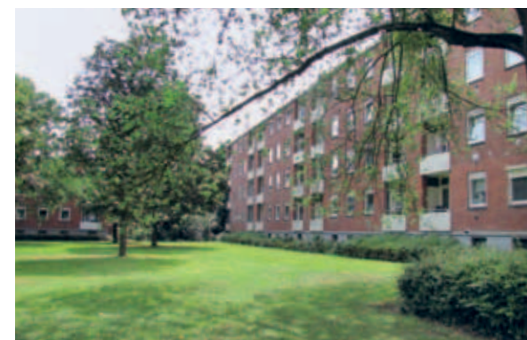
> De bomen vormen een mooi contrast met de gebouwen. Ze verzachten met hun losse vormen en losse plaatsing de harde lijnen en strenge ritmiek van de architectuur. Door hun hoogte zorgen de bomen ervoor dat de hoge flats 'buren' hebben die even hoog zijn, waardoor de gebouwen minder massaal overkomen.