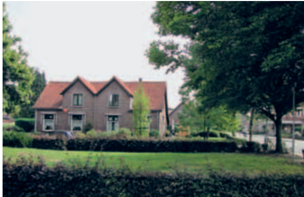
> Het Zwanenplein: een klein sieraad langs de Talingweg rondom een mooi gerenoveerd hofje. Het wijkt nauwelijks af van de omgeving, maar is door zijn stedenbouwkundige opzet rondom het centrale veldje toch iets bijzonders binnen de wijk.