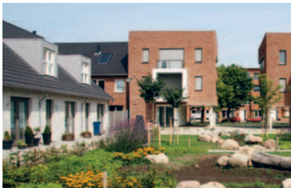
> De Ravenweg: grootschalige herontwikkeling waarbij niet alleen nieuwe binnenwerelden met een groene pit zijn gemaakt maar ook een nieuwe buitenrand.