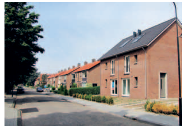
> Dezelfde ingrediënten als hiernaast worden gebruikt bij kleinschalige nieuwbouw, waardoor oud en nieuw goed aansluiten.

breder dan functioneel noodzakelijk is, waardoor er bijvoorbeeld extra zicht is op het Zuiderpark. Andere groenvakken voorkomen dat mensen niet vlak langs tuinen lopen en naar binnen kunnen kijken. Zo voorkomt het groen dat bewoners hoge schuttingen plaatsen om privacy te creëren.