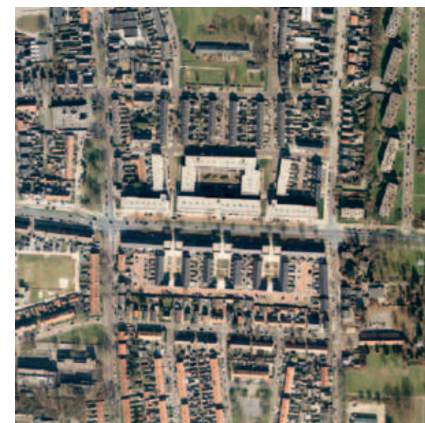
> Twee varianten op hetzelfde thema. Een complex in de luwte dat alleen bestaat uit een binnenwereld (links) en een complex dat deels aan de hoofdstructuur grenst (rechts). Het ene complex toont zich alleen aan degene die naar binnen gaat. De andere is ook zichtbaar voor de passant.