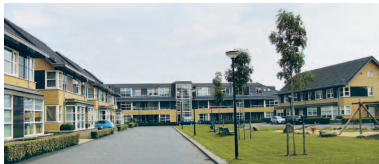
> De Transformatorhof: een complex van kleinschalige gebiedjes met een eigen opzet, bebouwingsvorm, architectuur, kleur en met een groen veldje middenin.