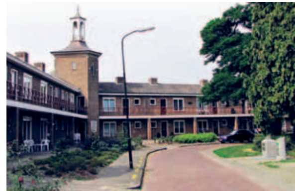
> Het Ibisplein: opnieuw een door wanden gevormde groene hof met een eigen architectuur en inrichting. De ruimte wordt afgebakend door de lange horizontale vleugels van het gebouw.