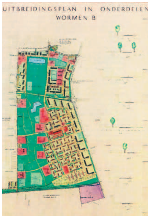
> Het uitbreidingsplan voor het meest rigide opgezette deel van Zuid, het Rivierenkwartier. De stempelverkavelingen ten oosten van het Zuiderpark zijn goed herkenbaar. Je ziet een herhaling van steeds dezelfde opzet ('stempels').

Tot 1850 bestond Zuid voornamelijk uit heidevelden, akkerbouwland en weilanden rondom buurtschap Wormen. In de tweede helft van de negentiende eeuw werden hier het zuidelijke tracé van het Apeldoorns Kanaal en de spoorlijnen richting Zutphen, Dieren en Deventer aangelegd. Al snel vestigden bedrijven zich langs het spoor en het kanaal. Door de lage grondprijzen verstedelijkten de dichtbij gelegen bebouwingslinten bij Wormen en de Wormensche Enk. Het gebied ontwikkelde zich tot een dichtbebouwde woonbuurt die tegenwoordig bekend staat als Brummelhof. Met de komst van meer bedrijvigheid langs het spoor en het kanaal startte Woningbouwvereniging De Goede Woning in de jaren dertig met de bouw van betaalbare arbeiderswoningen, zoals rond het Vogelplein. Dit waren de eerste meer planmatige uitbreidingen in Zuid.