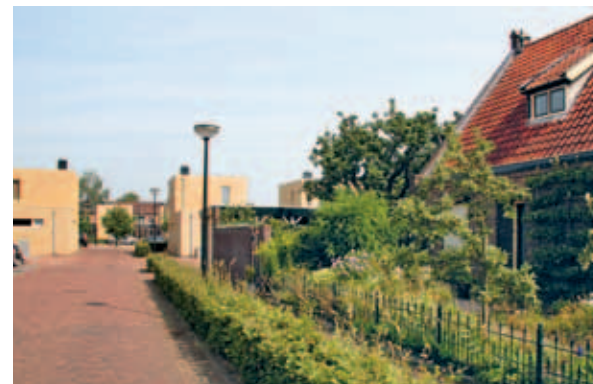
> De Veste: verborgen achter de oudere bebouwing ligt een pleintje met alle woningen zij aan zij eromheen. De gele baksteen en de kubusvormige opzet verbijzonderen het complex ten opzichte van de omgeving.