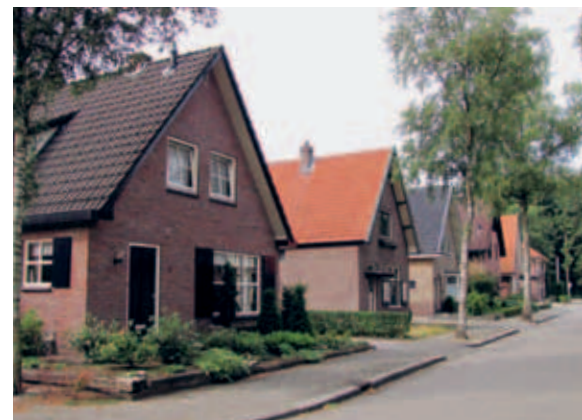
> Vrijstaande huizen passen in het sobere baksteenbeeld. Variaties zijn er alleen in dakpankleur.