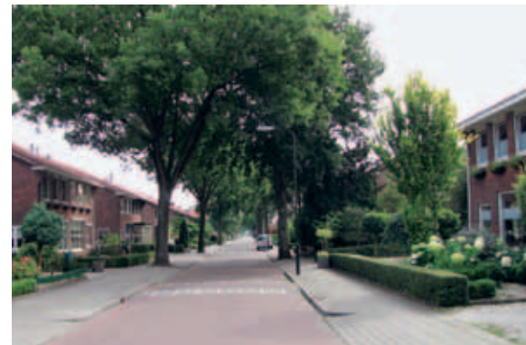
> Lange rechte straten met klassieke stoep-straat-stoepprofielen bepalen het beeld en ordenen de bebouwing. Bomen komen vooral langs de oost-west georiënteerde straten voor en hebben per straat een eigen soort.