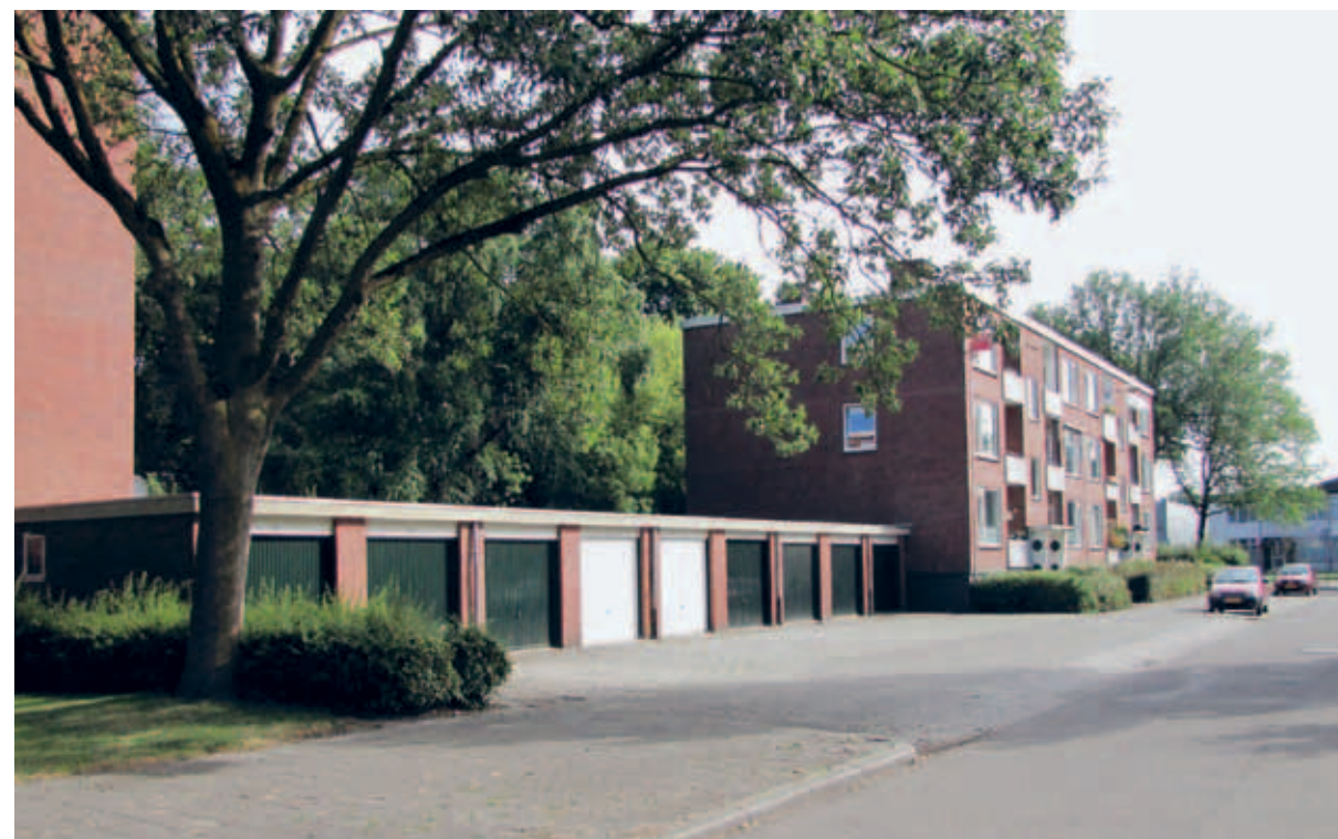
> Een ontworpen compositie van horizontalen, gevormd door gebouwen (hoog tot laag maar allemaal breed en lang) en aangevuld met het groen van strak gesnoeide hagen, grasvelden en struikrijen.

Ook het groen doet in die benadering en vormtaal mee met een spel van grote vlakken, rechte lijnen en variaties in groene kleurtinten. Een soort 'groene architectuur' die in nauwe samenhang is ontworpen met de 'stenen