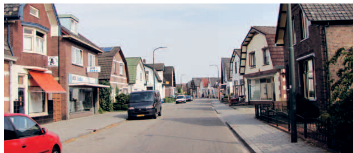
> De 1e Wormenseweg: een lint met stenige straten met veel variatie in dichtheid, vorm, richting, architectuur en kleur.