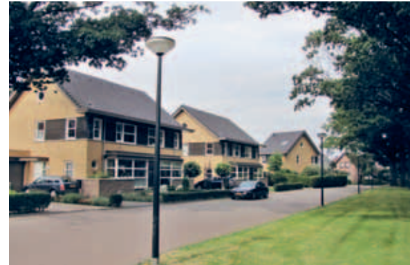
> De Transformatorhof: twee nieuwe hoven met een groene pit waar de bebouwing omheen gebouwd is. De gele baksteenarchitectuur bindt het geheel samen en verbijzondert de huizen ten opzichte van de omgeving.