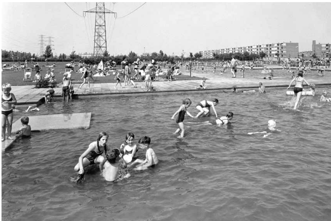
> Het Zuiderpark net na oplevering eind jaren zestig. Open ruimte voor stedelijke recreatie met bijvoorbeeld de spartelvijver (nu de locatie van Dok Zuid).