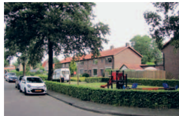
> Kleinere plekken en groenelementen liggen langs de noord-zuid georiënteerde straten. Ze zijn per straat net even anders, waardoor de wijk een rijke variatie aan straatbeelden krijgt.

Alle groene plekken en stroken in dit deel van Apeldoorn hebben een duidelijke functie en vorm. Die functie gaat verder dan alleen het gebruik, bijvoorbeeld als speelplek. De groenstroken hebben ook een rol in de ruimtelijke opzet van de wijk. Grasvlakken in de straat zijn daarom vaak