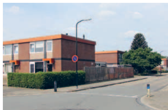
> De oranje dakrand op de bouwblokken benadrukt het horizontale karakter van elk gebouw en is daarmee een bindend stedenbouwkundig thema geworden.