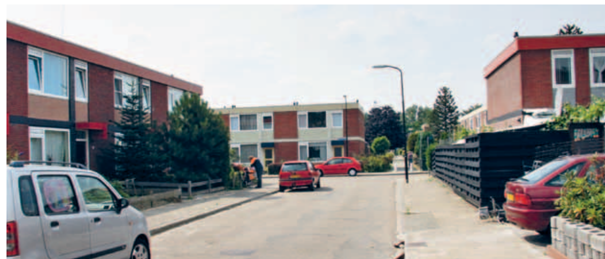
> De drie smaken van Zuid: kwartieren, linten en complexen. Op deze foto het Rivierenkwartier: planmatige en grootschalige wijkbouw met veel herhaling in opzet, verkaveling, hoogte, architectuur en kleur.

De subtiele verschillen zijn om te koesteren en te gebruiken als inspiratiebron voor nieuwbouw, zoals is gedaan in bijvoorbeeld de recente nieuwbouw langs de Ravenweg en bij de renovaties van bestaande woningen.