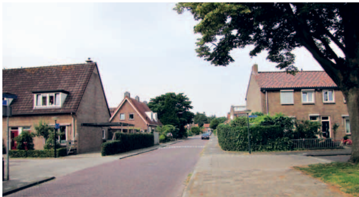
> Sobere lichtbruine baksteen en rode of grijsbruine pannendaken domineren het straatbeeld van het Componistenkwartier.

intact. De kortere noord-zuid straten zijn minder belangrijk voor de eenheid op buurt- of wijkniveau. Daarom kunnen die straten ook meer variatie en verschillen hebben als ze worden aangepakt.