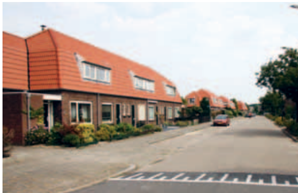
> De Vogelbuurt: een klassiek tuindorp waarbij de gebouwen de ruimte afbakenen tot straten en pleintjes. De rode mansardekappen bepalen het beeld en maken duidelijk waar de buurt begint en eindigt.