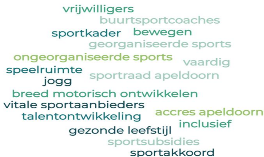
Afbeelding 2, Een breed en divers speelveld als basis voor sport en bewegen

Als gemeente zien wij het bestaande sport- en beweegaanbod als basis voor onze ambities en doelstellingen. Onderstaande impressie is gebaseerd op dit aanbod en relevante actuele thema's. Al deze thema's hebben een plek gekregen in het Sportakkoord, inclusief ambities en actiepunten.